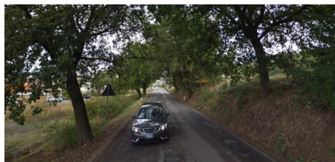
NUOVO PUNTO DI IMMISSIONE VISIBILITA' IN DIREZIONE PONTE SAN GIOVANNI