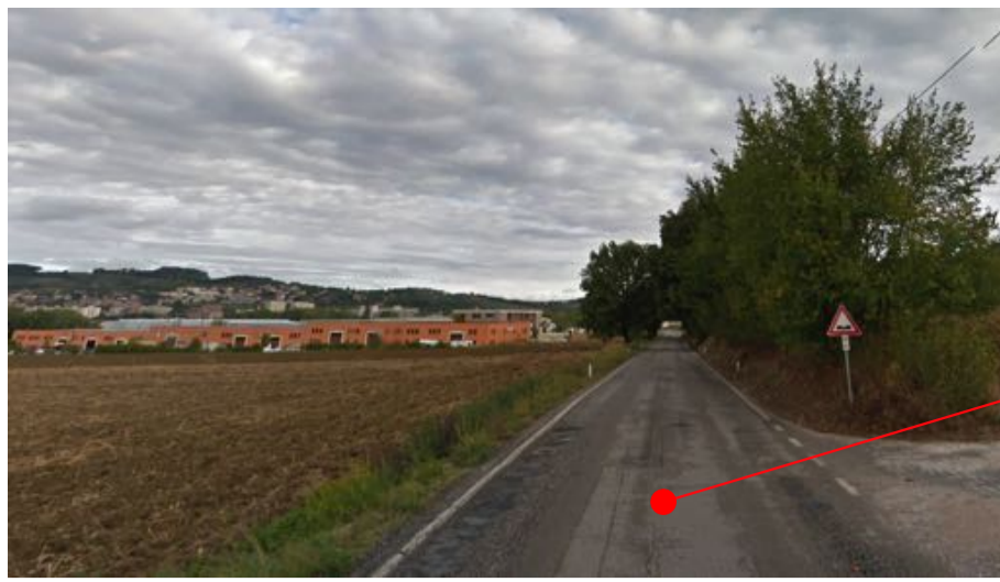
VISTA A - DAL DOSSO