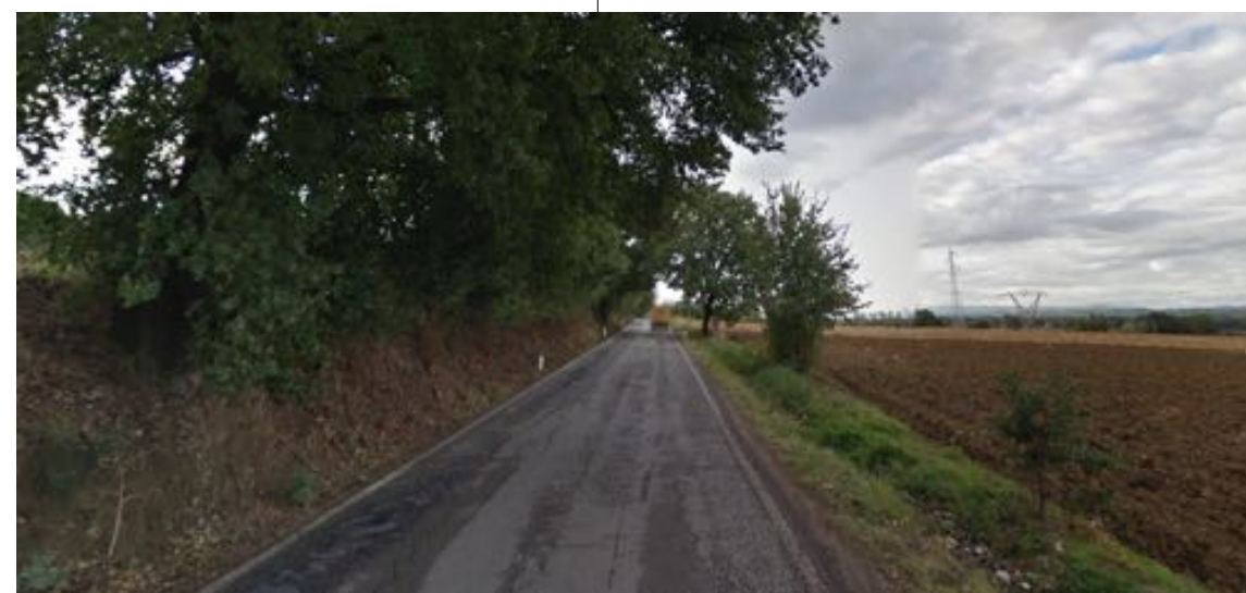
NUOVO PUNTO DI IMMISSIONE VISIBILITA' IN DIREZIONE TORIGIANO