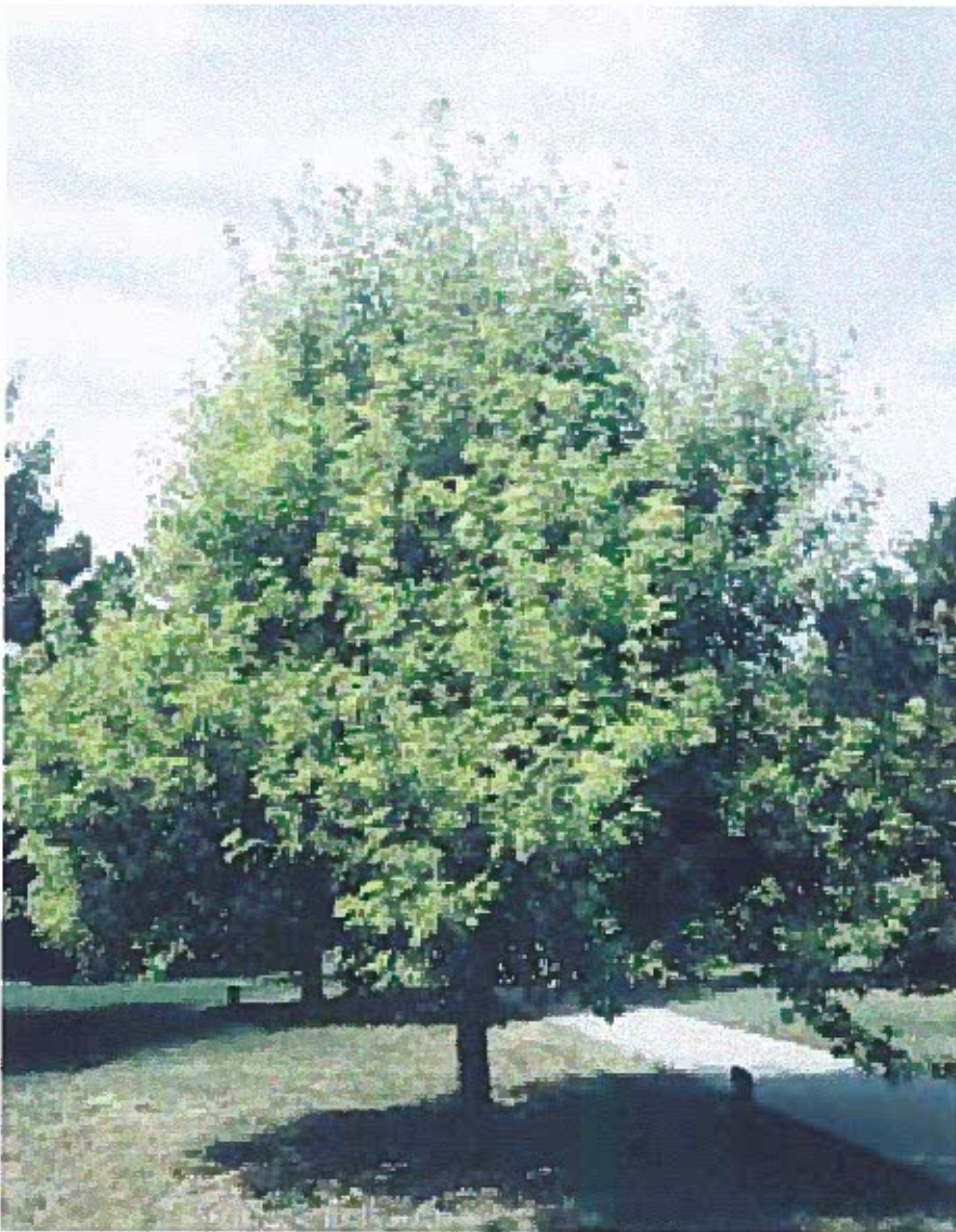
ACERO PSEUDO PLATANIS